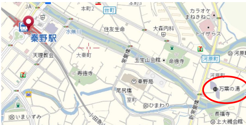
秦野駅との位置関係